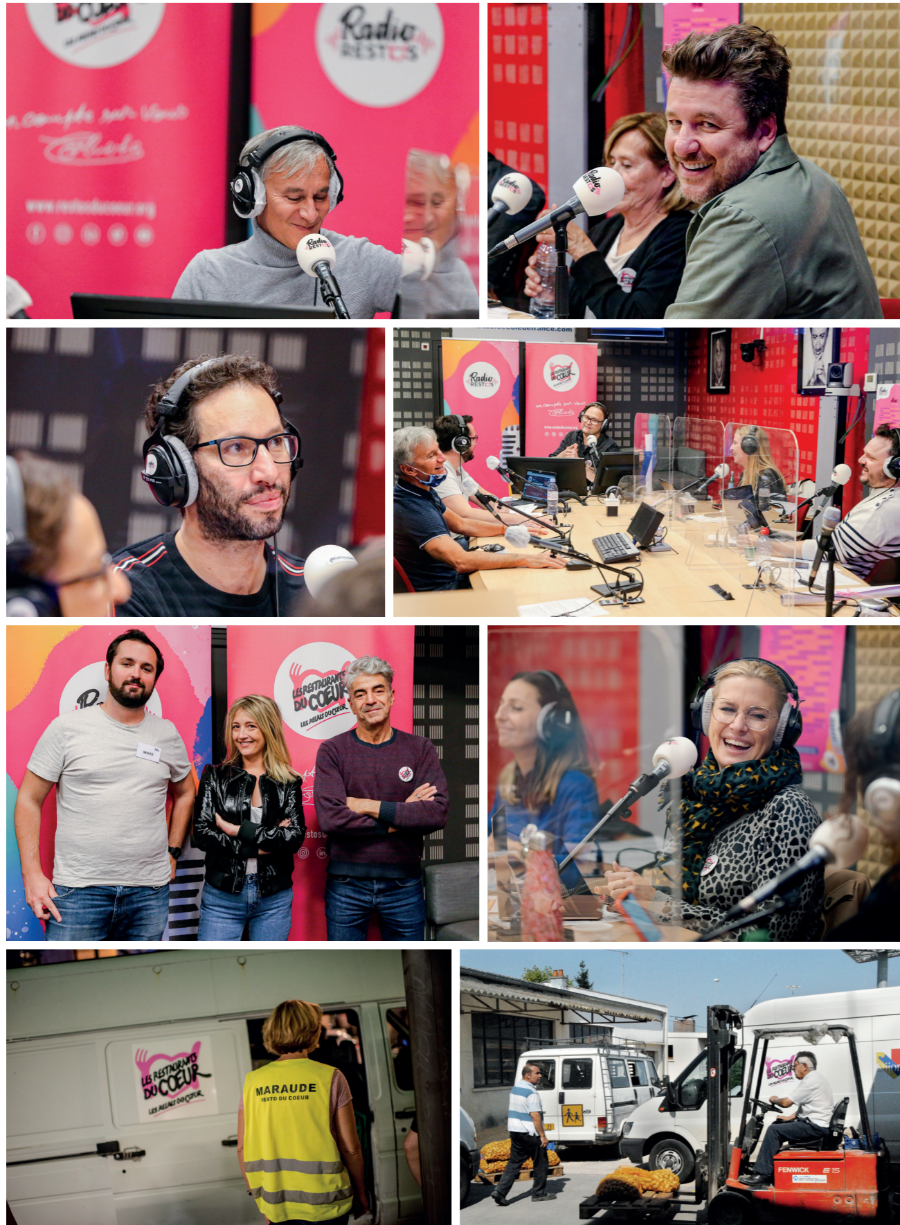
© Sylvie Grosbois - Rolando Quintas - Pascal Ito - Eric Patin