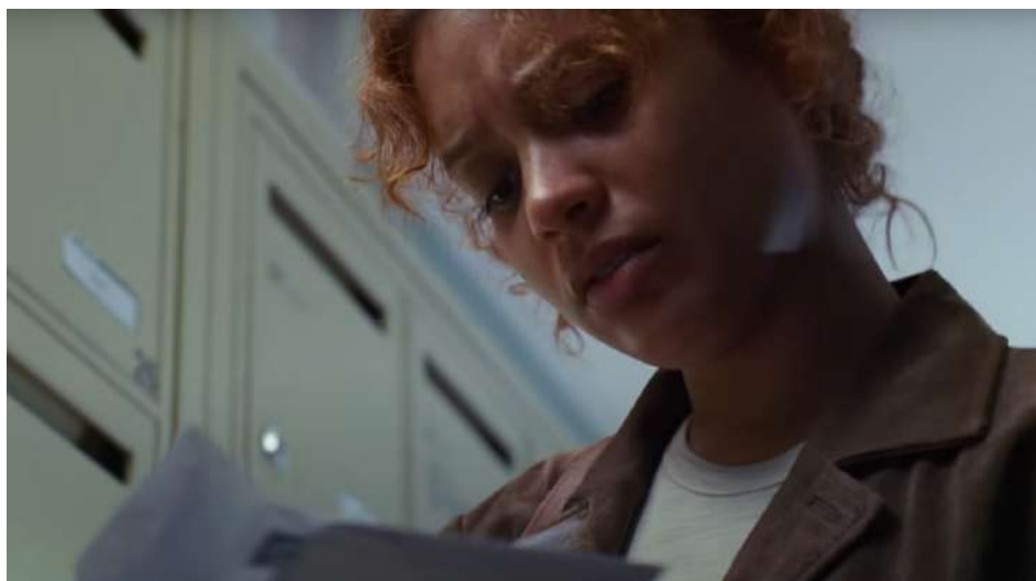
Extrait du clip de lancement de la 39 e campagne des Restos du Cœur. Agence : Change

Président bénévole de l'Association nationale des Restos du Cœur